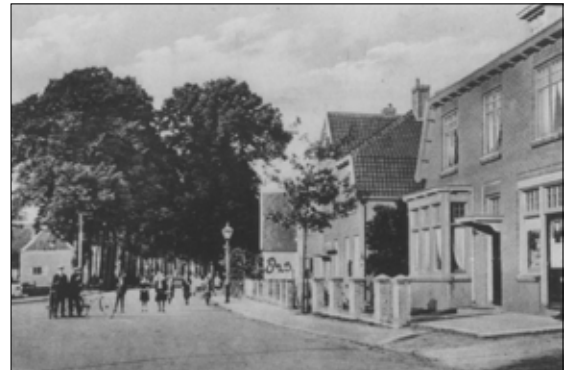
Hatertseweg, voorheen Dorpstraat (Hatert), rond 1935

Huize Duckenburg ligt in de wijk Lankforst. Huis Hulzen is omstreeks 1880 afgebroken. Op de plaats van de oprijlaan ligt nu de Hulzenseweg (wijk Goffert).