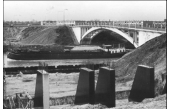
Bouw van de Hatertsebrug, 1972

Aan de overkant van het kanaal, grenzend aan de wijk Weezenhof, ligt een fabriek waar ze betonnen rioleringen en bestratingsmaterialen maken: de Nijmeegse Betonindustrie De Hamer.