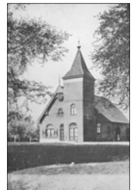
De afbraak van de toren van de H. Antonius Abt (links), Huis Hatert, 1919 (rechts)